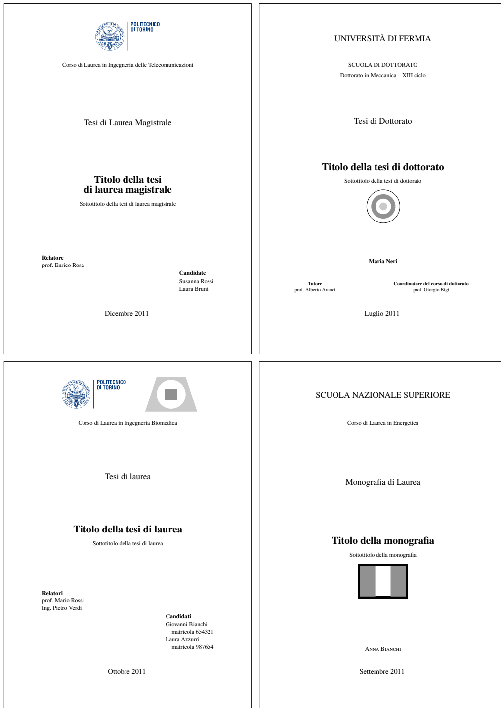
Figura 3.1. I quattro frontespizi fondamentali