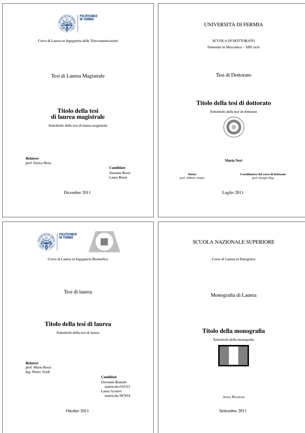
Figura 3.1. I quattro frontespizi fondamentali